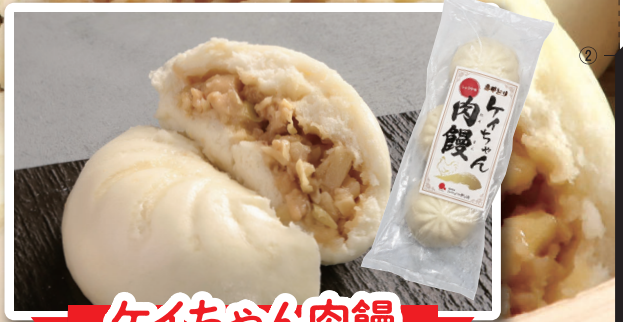
ケイちゃん肉饅頭